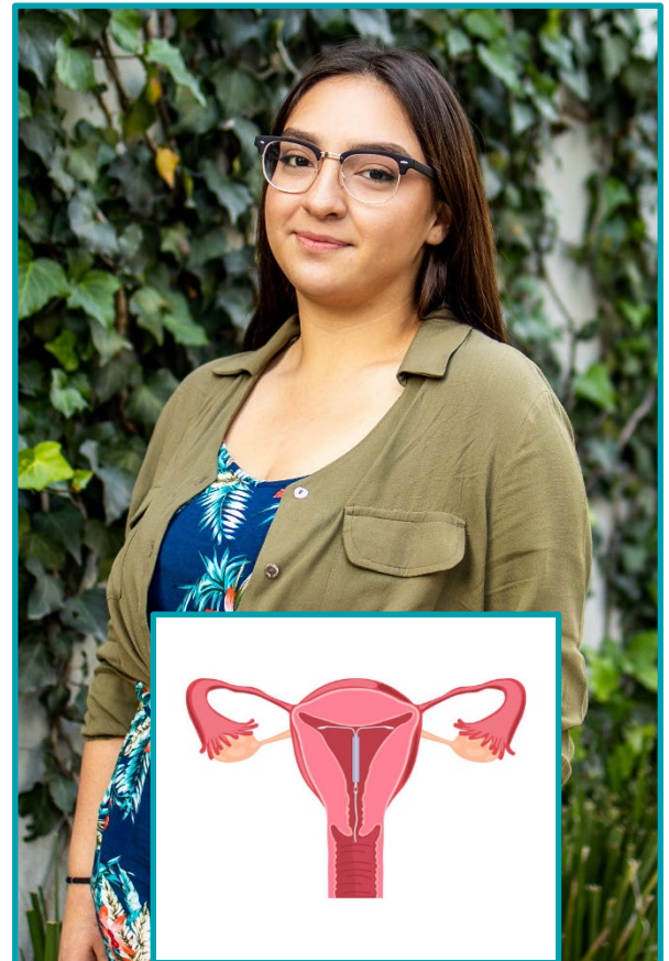
Este DIU se coloca en el útero.